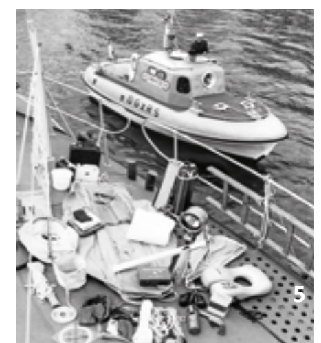
Unsere Spezialausrüstung: Die heutigen Seenotrettungsboote sind im Einsatz mit mindestens drei Freiwilligen besetzt. Ihnen steht modernstes Rettungsgerät zur Verfügung (4). Auch auf den ersten 7-Meter-Seenotrettungsbooten (5) fand bereits viel spezielle Ausrüstung für verschiedene Einsatzszenarien Platz.