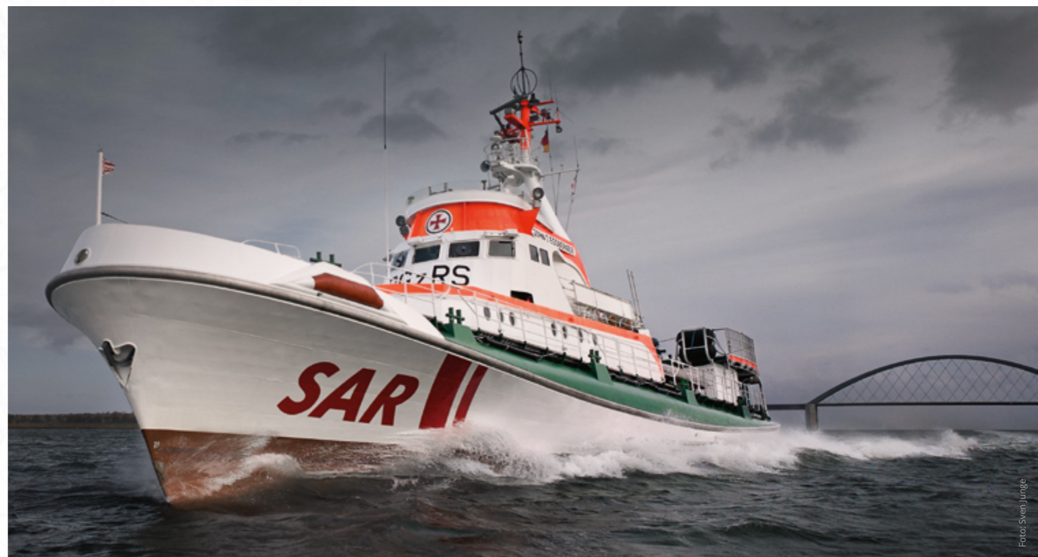
Am 2. Mai 2011 ist die JOHN T. ESSBERGER zum letzten Mal unter der Fehmarnsundbrücke hindurchgefahren, Kurs: Nord-Ostsee-Kanal.