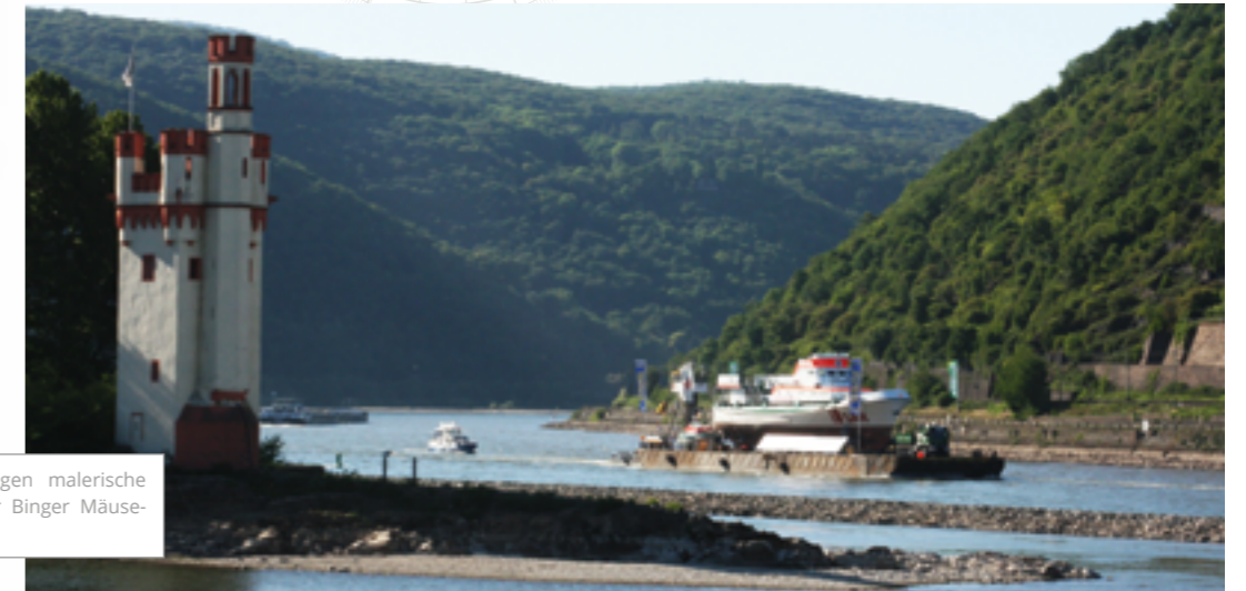
Im romantischen Rheintal liegen malerische Burgen und Schlösser wie der Binger Mäuseturm an der Strecke.