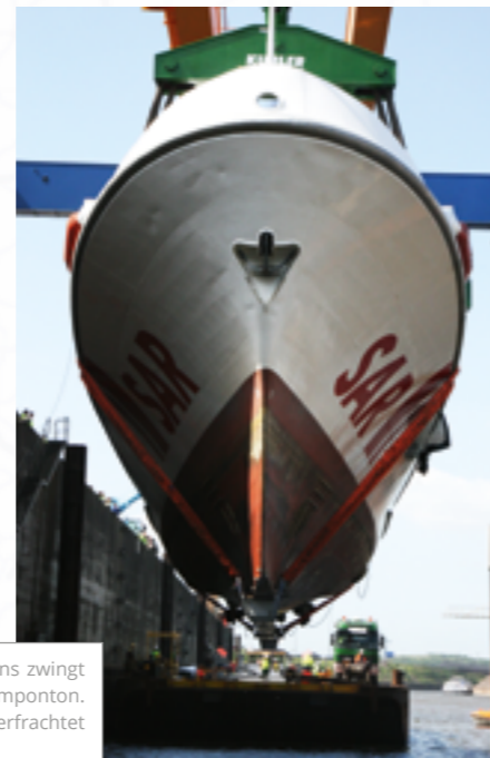
Unvorhersehbar extremes Niedrigwasser des Rheins zwingt das 44-Meter-Schiff in Duisburg auf einen Schwimmponton. Zuvor ist bereits in Dordrecht Ausrüstung auf Lkw verfrachtet worden, um den Tiefgang zu reduzieren.