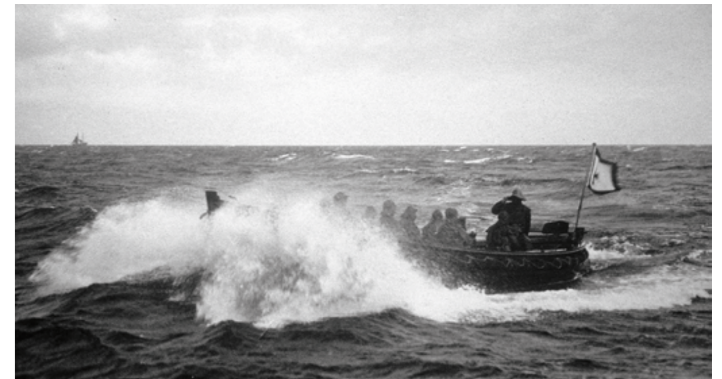
Mit ihren 15 PS beschleunigte die Maschine das erste Motorrettungsboot der DGzRS, die OBERINSPECTOR PFEIFER, auf bis zu 6,5 Knoten.

Vor 110 Jahren haben die Seenotretter mit der Motorisierung ihrer Rettungsflotte begonnen. Das erste Motorrettungsboot der DGzRS fuhr im März 1911 seinen ersten Einsatz auf der Ostsee vor Laboe.