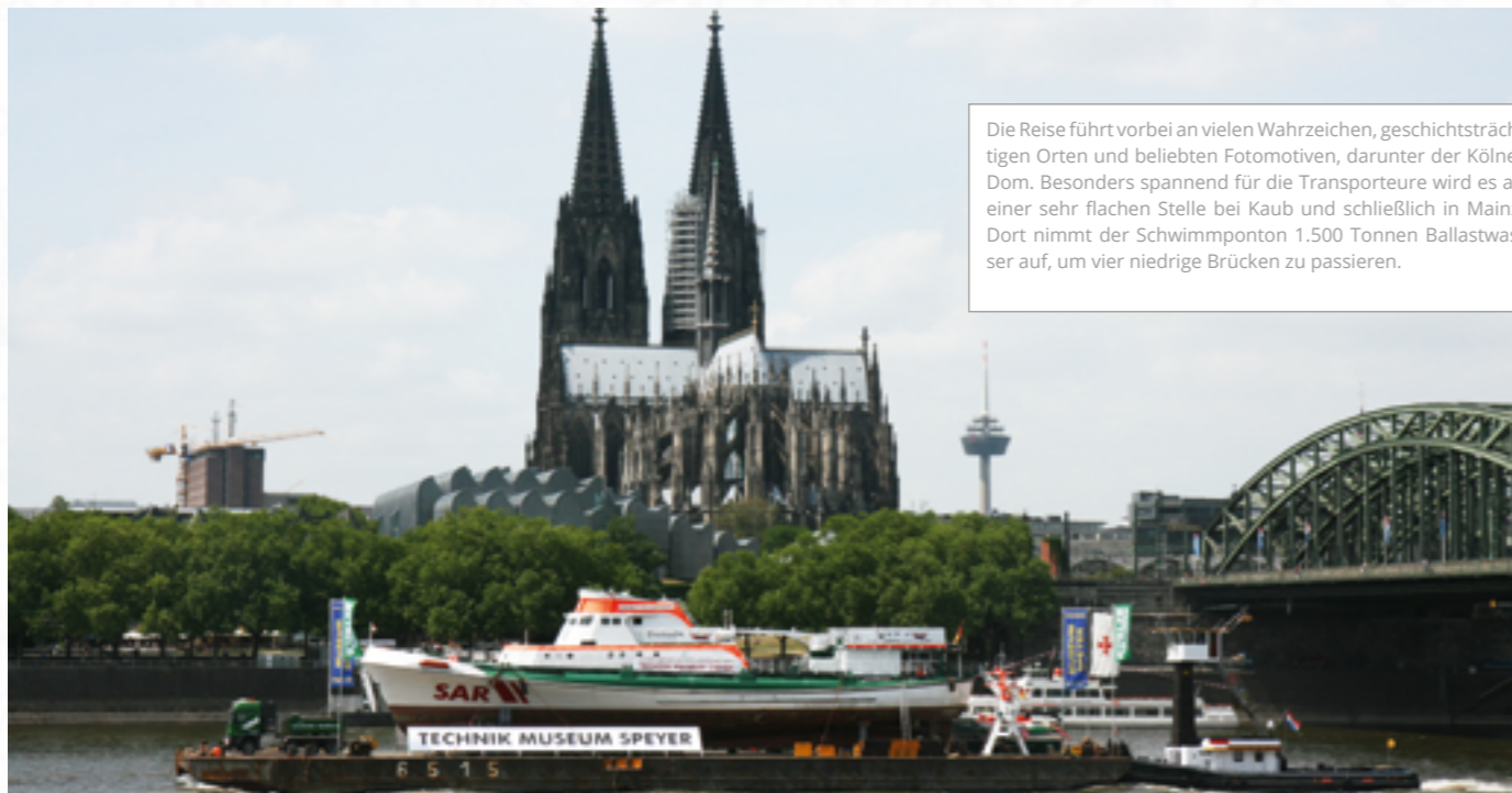
Die Reise führt vorbei an vielen Wahrzeichen, geschichtsträchtigen Orten und beliebten Fotomotiven, darunter der Kölner Dom. Besonders spannend für die Transporteure wird es an einer sehr flachen Stelle bei Kaub und schließlich in Mainz: Dort nimmt der Schwimmponton 1.500 Tonnen Ballastwasser auf, um vier niedrige Brücken zu passieren.