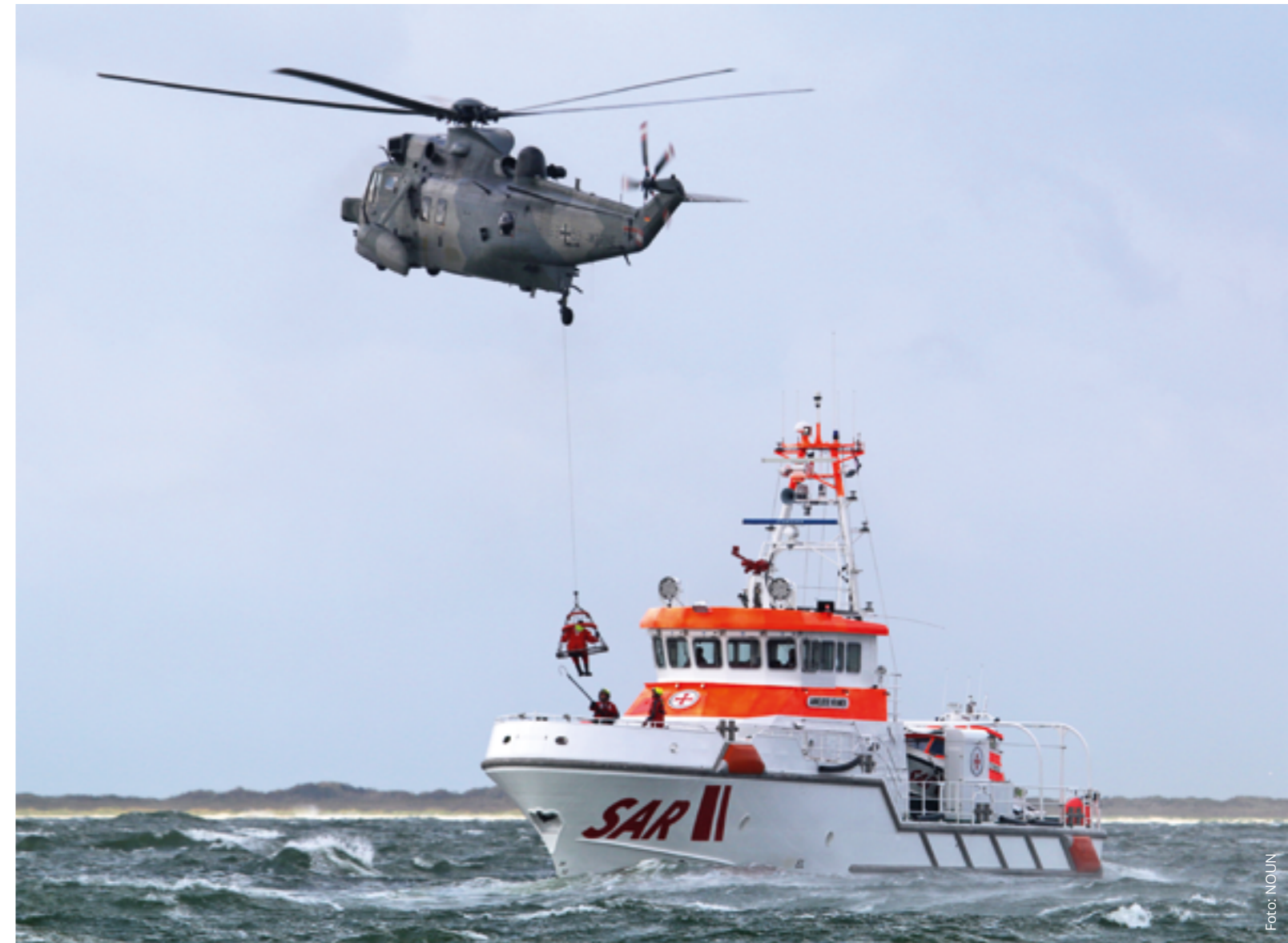
Menschen aus Seenot zu retten ist Teamarbeit. Damit die Seenotretter und ihre fliegenden Partner erfolgreich sind, trainieren sie ständig die Zusammenarbeit – ab sofort auch virtuell in einem gemeinsamen Simulator-Forschungsprojekt.

N ach zweitägiger Seereise über Weser, Nordsee, Nord-Ostsee-Kanal, Ostsee und Schlei hat das neue Seenotrettungsboot SRB 82 im Frühjahr erstmals den Schleswiger Stadthafen angelaufen. Am 28. März machten es die freiwilligen Seenotretter der Station Schleswig an seinem neuen Liegeplatz fest. Dort hat die 8,9 Meter lange Rettungseinheit die WALTER MERZ ersetzt, die nach 28 Einsatzjahren außer Dienst gestellt wurde. Das 8,5 Meter lange Seenotrettungsboot wird weiterhin Leben retten und wird künftig voraussichtlich vom freiwilligen estnischen Seenotrettungsdienst Pärnu SAR eingesetzt. Wann SRB 82 bei einer Taufe seinen endgültigen Namen erhalten wird, war aufgrund der Pandemie bei Redaktionsschluss noch offen.