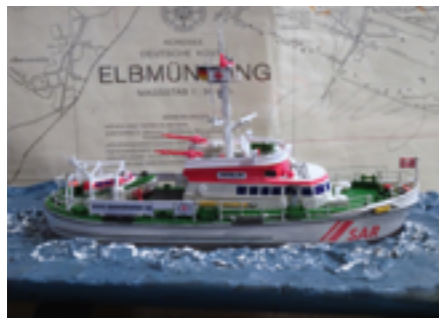
Macht auch in der Buddel eine gute Figur: die 2017 außer Dienst gestellte BERLIN.

Passenderweise hat der Buddelschiffer auch den 27,5 Meter langen Seenotrettungskreuzer BERLIN geschrumpft. Neun Monate dauerte die Arbeit daran. „Ich habe aus einem Nachlass Zeichnungen des Schiffs erhalten. Das war eine gute Grundlage für die Konstruktion.“ Wie beim großen Vorbild verlief auch die Buddel-Montage in mehreren Schritten: Erst kam der Rumpf mitsamt Tochterboot STEPPKE in die Flasche, dann das Deckshaus und zum Schluss der Mast. „Die BERLIN ist wirklich ein schnittiges Schiff!“, lautet das Fazit des Experten. Das gilt im Kleinen, wie im Großen.