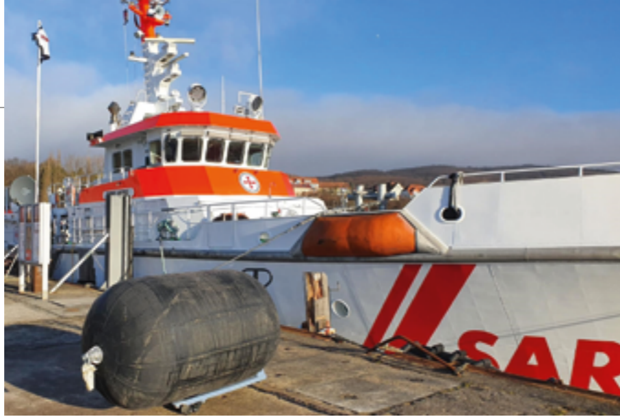
Aufgepumpt und bereit für seine schützende Aufgabe: Einer der beiden pneumatischen Schwimmfender liegt vor dem Seenotrettungskreuzer HARRO KOEBKE an der Westmole im Sassnitzer Hafen.