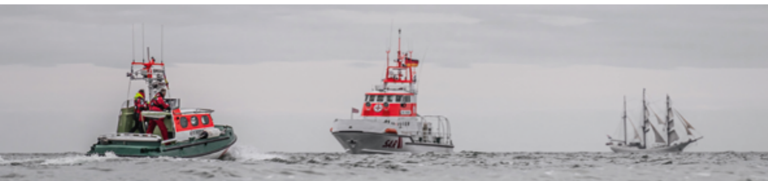
In ihrem Revier vor dem Darß: der Seenotrettungskreuzer THEO FISCHER mit seinem Tochterboot STRÖPER